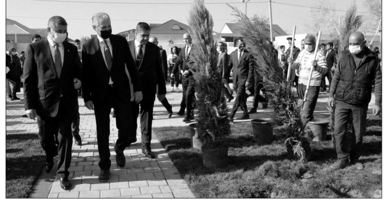
Abidə ətrafında Şirvan şəhərindən olan 157 şəhidin hər birinin şərəfinə ağac əkilib,